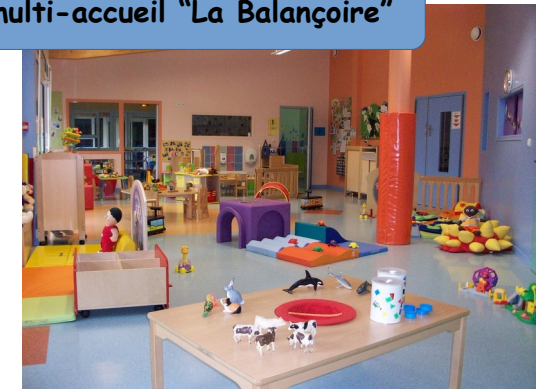
Le multi-accueil "La Balançoire"